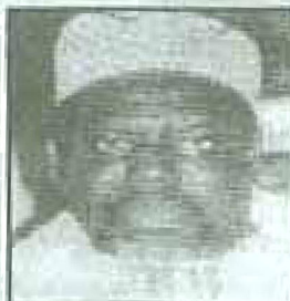
المنير علي سني بالسنغال (حتى الآن)