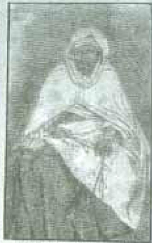
أحمد بن الحاج علي التماسيني 1230-1292