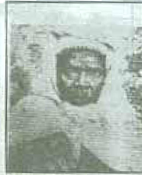
محمد أناسير بن عبد الله ت. 1957