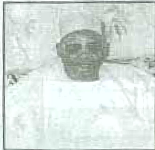
الحاج أحمد دان بن إبراهيم ت. 1957