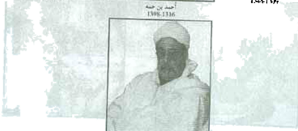
أحمد بن أحمد بن أحمد بن أحمد الشيخ العجلي أولاد . 171