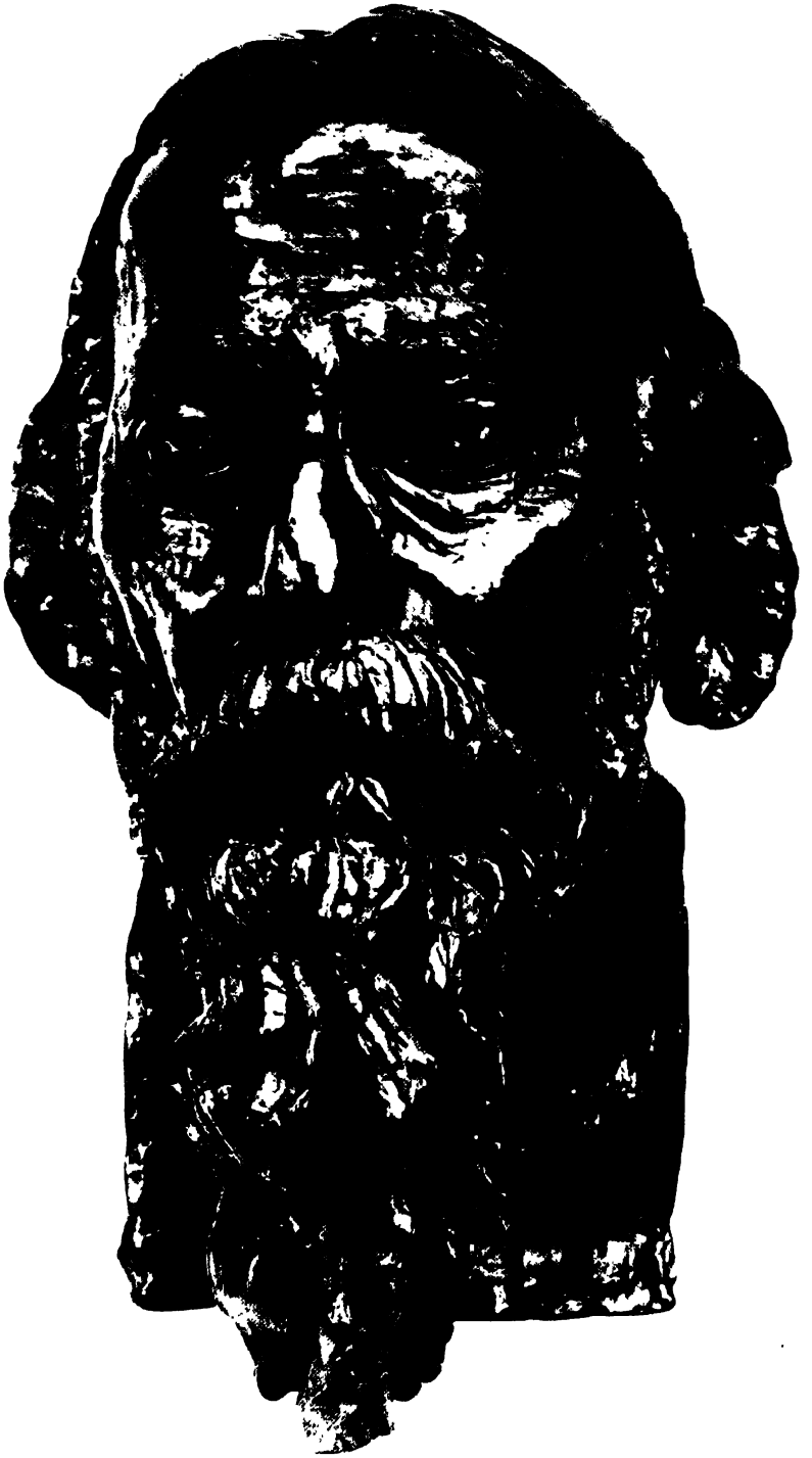
रवीन्द्रनाथ : आवक्ष कांस्य कृति मूर्तिकार : जेकब एपस्टाइन